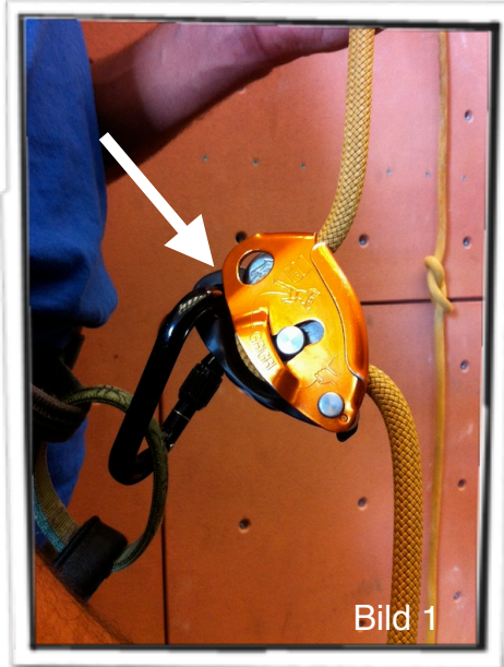
Fel inkopplad Grigri med endast den fasta sidoplåten i låskarbinen!