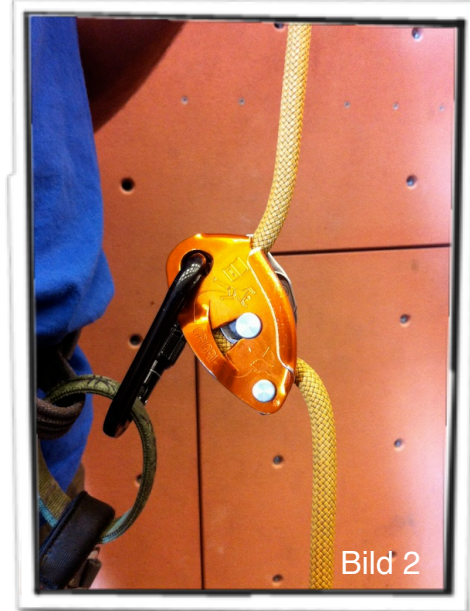
Rätt inkopplad Grigri med båda sidoplåtarna i låskarbinen.